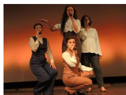
NIDDA Einmaliges „Come together“ im Bürgerhaus Nidda