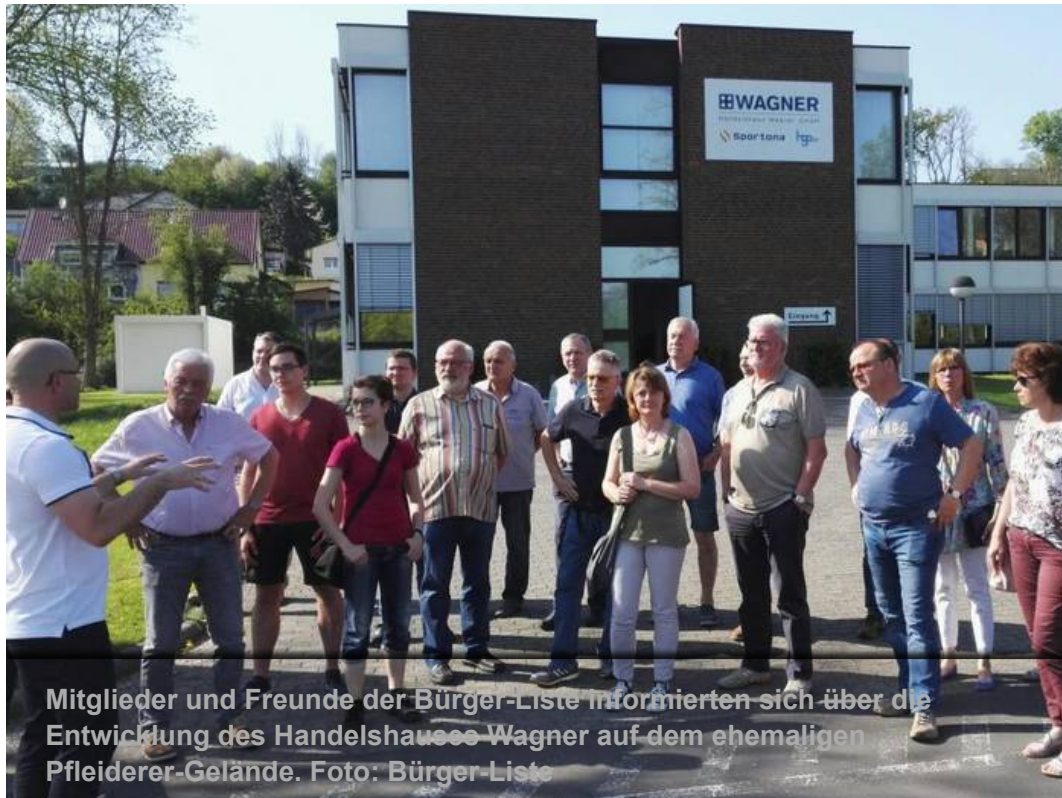
Mitglieder und Freunde der Bürger-Liste informierten sich über die Entwicklung des Handelshauses Wagner auf dem ehemaligen Pfeleiderer-Gelände.