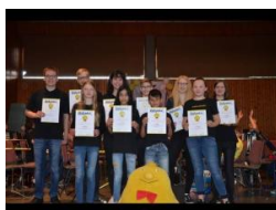
GLAUBURG Spielend herantasten